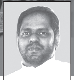
ഫാ. മാത്യു ചിനയിൽ

‘കാലത്തിന്റെ പൂർണ്ണതയിൽ പിതാവായ ദൈവം തന്റെ ഏകജാതനെ ലോകത്തിലേക്കയച്ചു. ലോക രക്ഷകന്റെ പിറവിക്കായി ലോകം കാത്തിരുന്നു. ആ ലോക രക്ഷകന്റെ പിറവിത്തിരുനാൾ ദിനമാണ് ക്രിസ്തുമസ്.