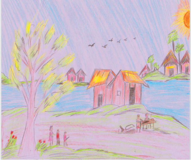
ഇറ്റലിയിലെ ബോവീസിയോ എന്ന ഗ്രാമം