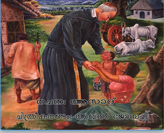
രചന: ആസാദ് ചിത്രീകരണം: അഖിതർ ജോസഫ്